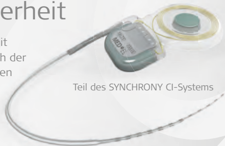
Teil des SYNCHRONY CI-Systems

Das SYNCHRONY Implantat bietet MRT-Sicherheit bis zu 3,0 Tesla ohne Magnetentfernung, da sich der einzigartige Magnet im Gehäuse selbst ausrichten kann. Das ist die beste MRT-Sicherheit, die ein Implantat derzeit bieten kann.